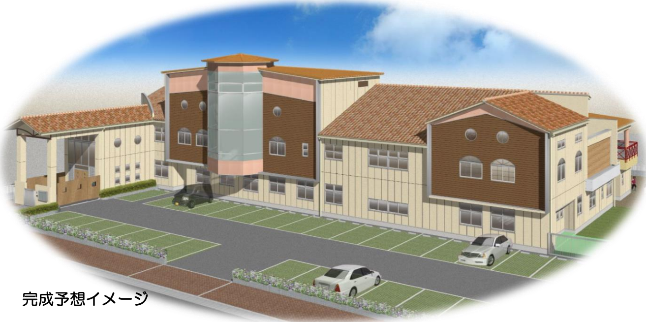
完成予想イメージ